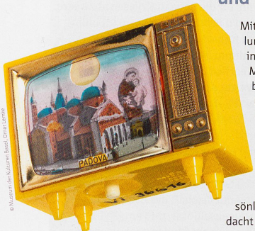
Andenken an eine Reise oder Wallfahrt; Padua, Italien; 1969

26. Juni–5. Juli 2024, Museum der Kulturen Basel, Augustinergasse 2 → mkb.ch