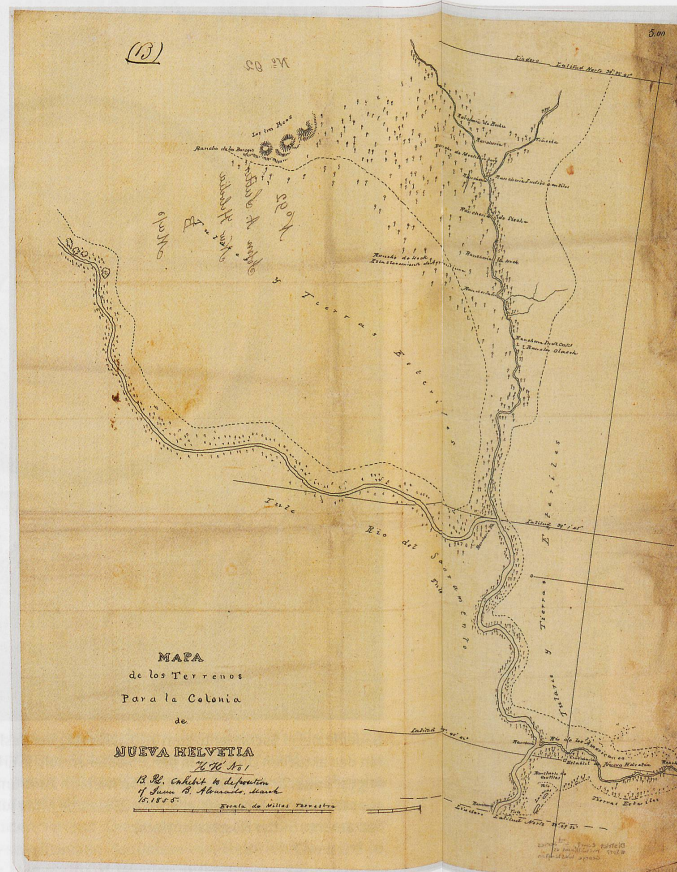
▲ Karte des Gebiets von Neu-Helvetien, 1841–1843