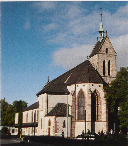
Die gotische Theodorskirche steht im Wettstein-Quartier und ist dem heiligen Theodor geweiht.

Theodorskirche Basel, Eintritt frei/Kollekte → erk-bs.ch/kg/kleinbasel/veranstaltung/