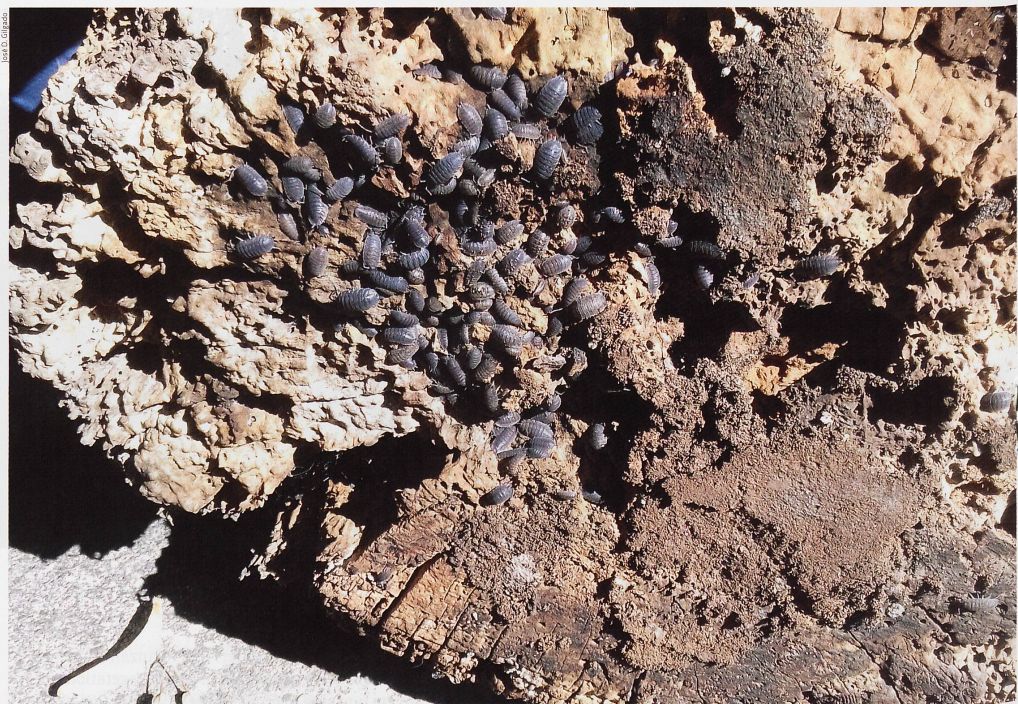
▲ Asseln unter Totholz