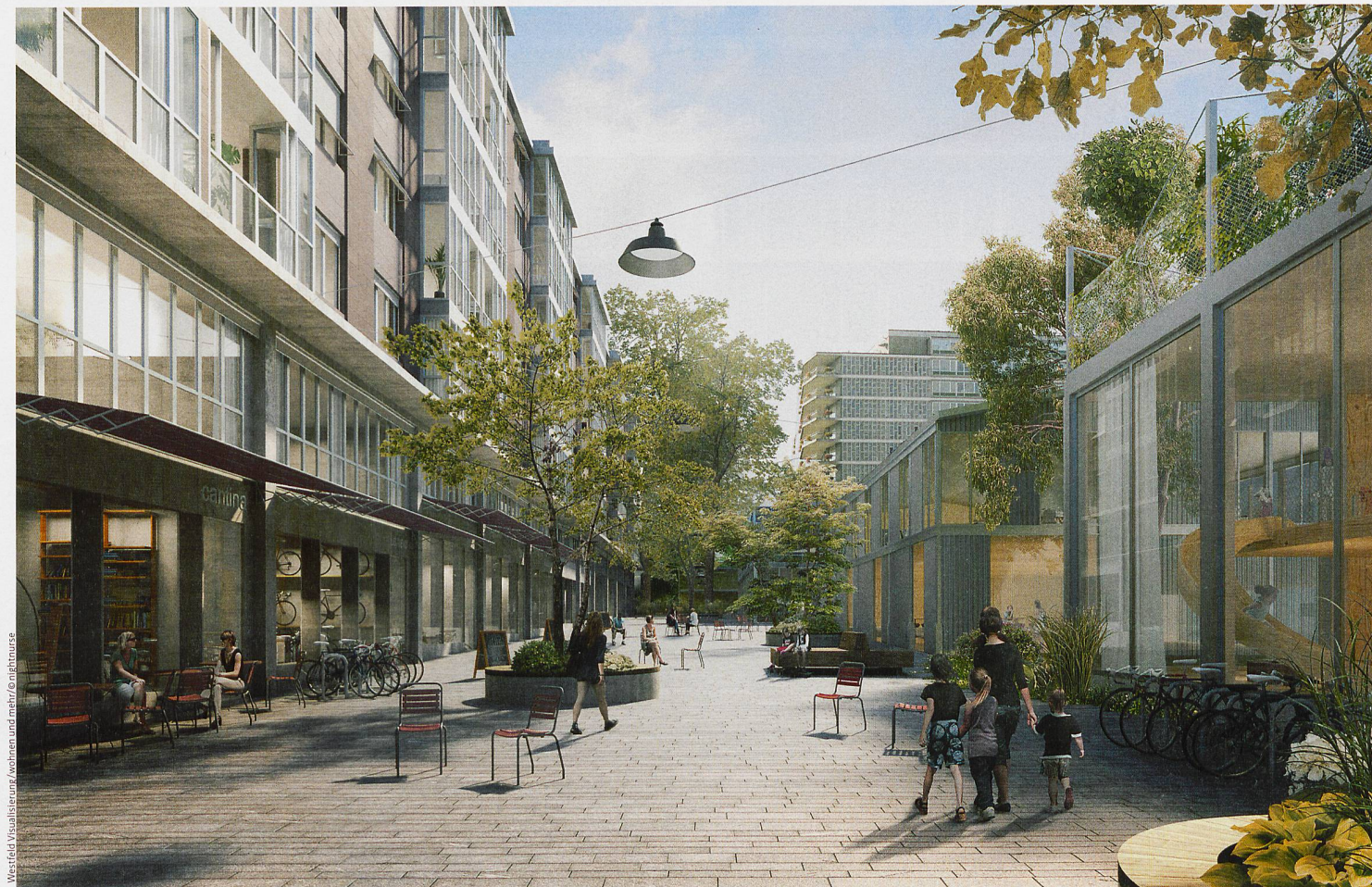
Westfeld Visualisierung/wohnen und mehr/© nightnurse

Das Areal bietet zahlreiche Begegnungsorte.