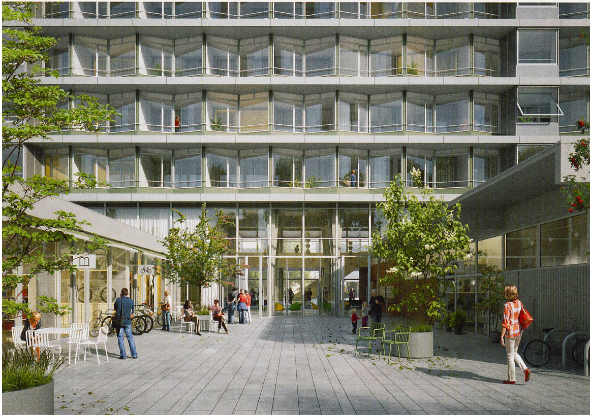
Im Westfeld gibt es für die Quartierbevölkerung nicht nur Wohnungen, sondern auch Dienstleistungen, Einkaufsmöglichkeiten und Treffpunkte.

feld – das alte und das neue Spital – werden durch eine Blockrandbebauung (elf Häuser mit je sechs bis sieben Stockwerken) und einen Wohnhof ergänzt, der quasi sinnbildlich für das gemeinschaftliche Wohnen steht. Zwischen den drei grossen Bausteinen befindet sich eine Freifläche, ergänzt durch niedrige Pavillons. Sie bieten Flächen für Quartiernutzungen und Kleingewerbe.