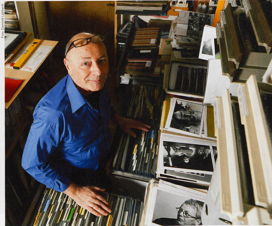
Viel Zeitgeschichte befindet sich im Archiv von Claude Giger.