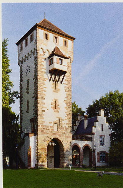
Das St. Alban-Tor einst ein Teil der Stadtmauer

Mi, 29. April, 18.30 Uhr Vortrag und Führung durch die Gartenbaubibliothek, → heimatschutz-bs.ch