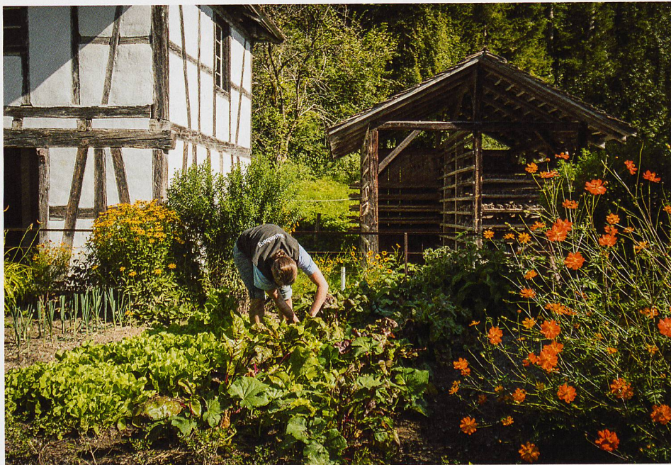
Gemüse- und Kräutergarten auf dem Ballenberg