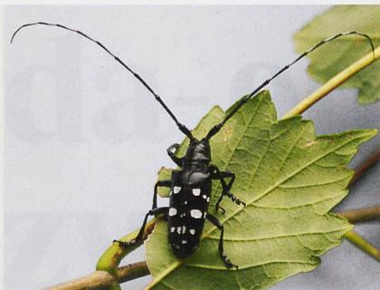
Ein Asiatischer Laubholzbockkäfer