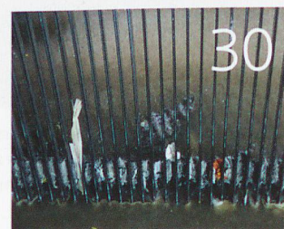
Abwasser: von Papier bis Kokain