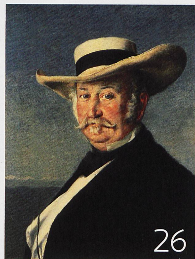
General Sutter, Gemälde von Franz Buchser