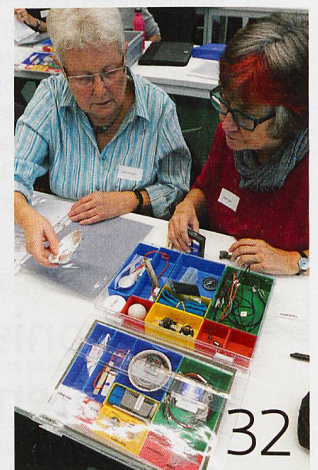
Technik-Grosi und Naturkunde-Nonno