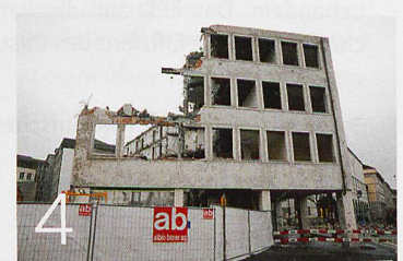
Arealentwicklung in Basel