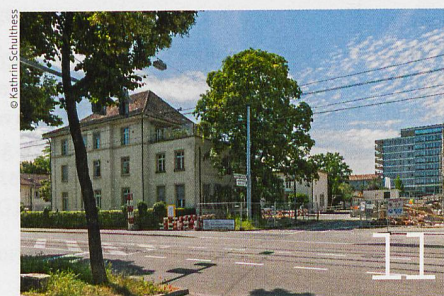
Wohnen und Arbeiten im Westfeld