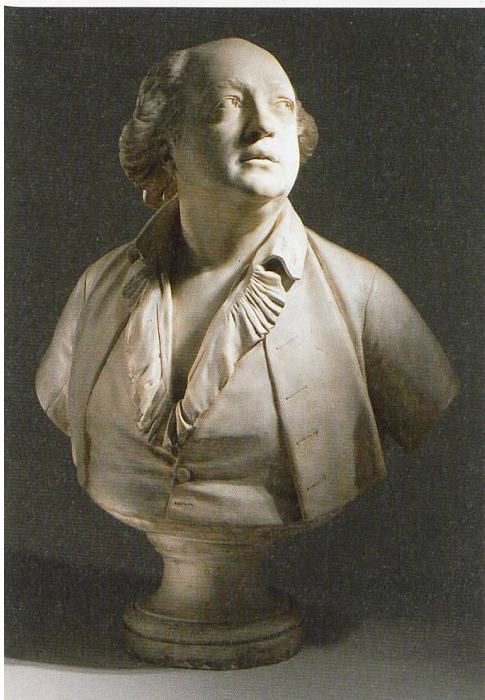
Jean-Antoine Houdon: Büste des Giuseppe Balsamo, genannt Alessandro Graf von Cagliostro, Paris ca. 1786