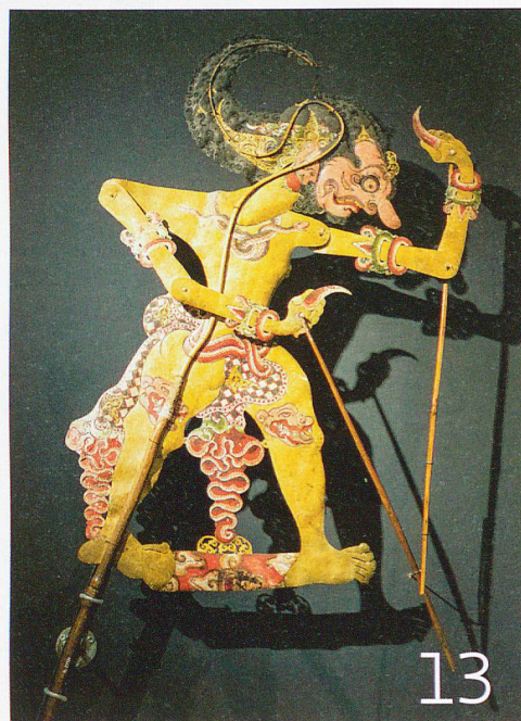
Bima ist ein Prinz und Held im indischen Epos Mahabharata. Seine Daumennägel sind seine Wunderwaffe. Stabpuppe aus Indonesien.