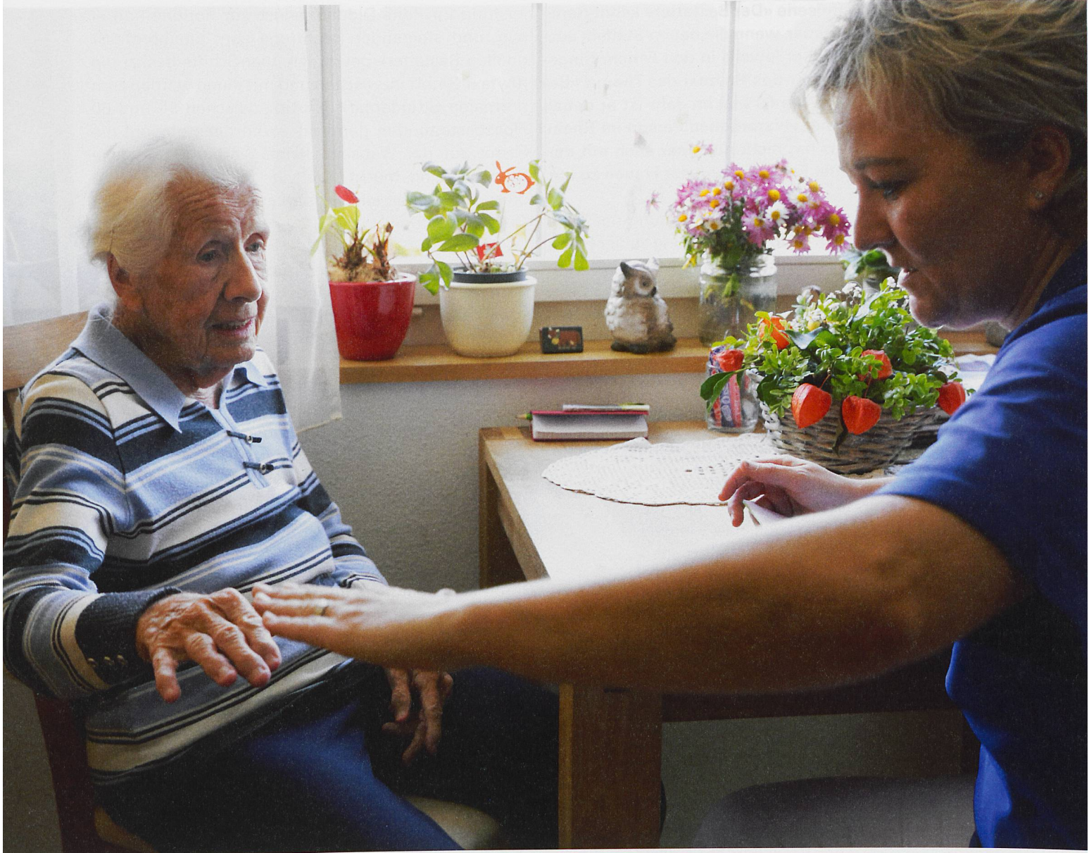
Im Alters- und Pflegeheim Moosmatt in Reigoldswil: Das Pflegepersonal ist nicht nur in der Pflege, sondern auch im Sterbeprozess gefordert.