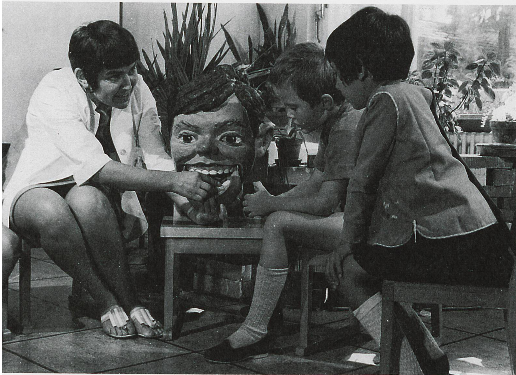
Schulzahnpflege in den 1960/70er-Jahren

Sie standen unter der Aufsicht einer älteren Ärztin, die seit Jahr und Tag ihrem freudlosen Gewerbe nachging. Aber nicht nur sie kannte ihre Untergebenen – auch im Warteraum wurden die auszubildenden Mitarbeiterinnen durch die Kinder eingeschätzt, benannt und qualifiziert.