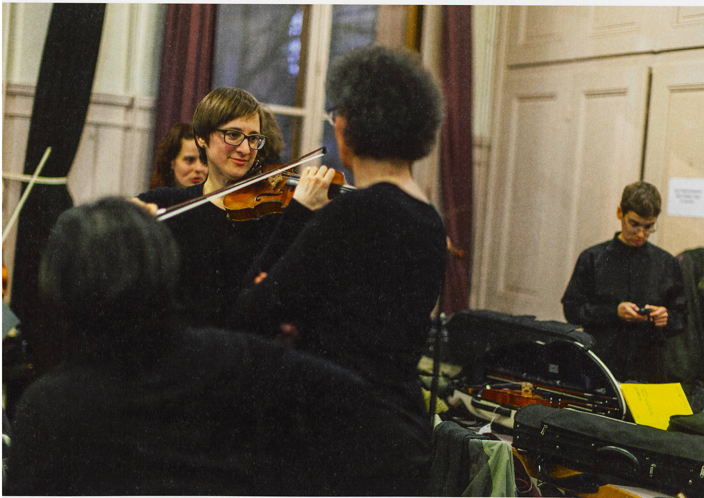
Vor dem Auftritt