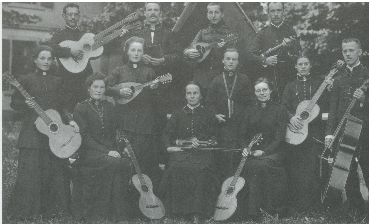
Gitarrenbrigade von Gurzelen BE (1912)