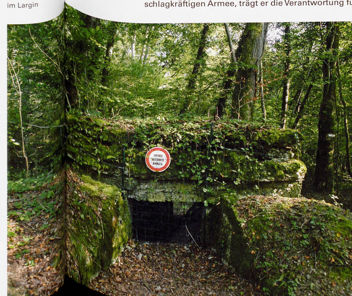
Bild unten Deutscher Bunker im Largin

Man weiss es: Die Schweiz blieb vom grossen Morden verschont. Gleichwohl gibt es im Städtchen Laufen ein Soldatendenkmal für die Gefallenen des