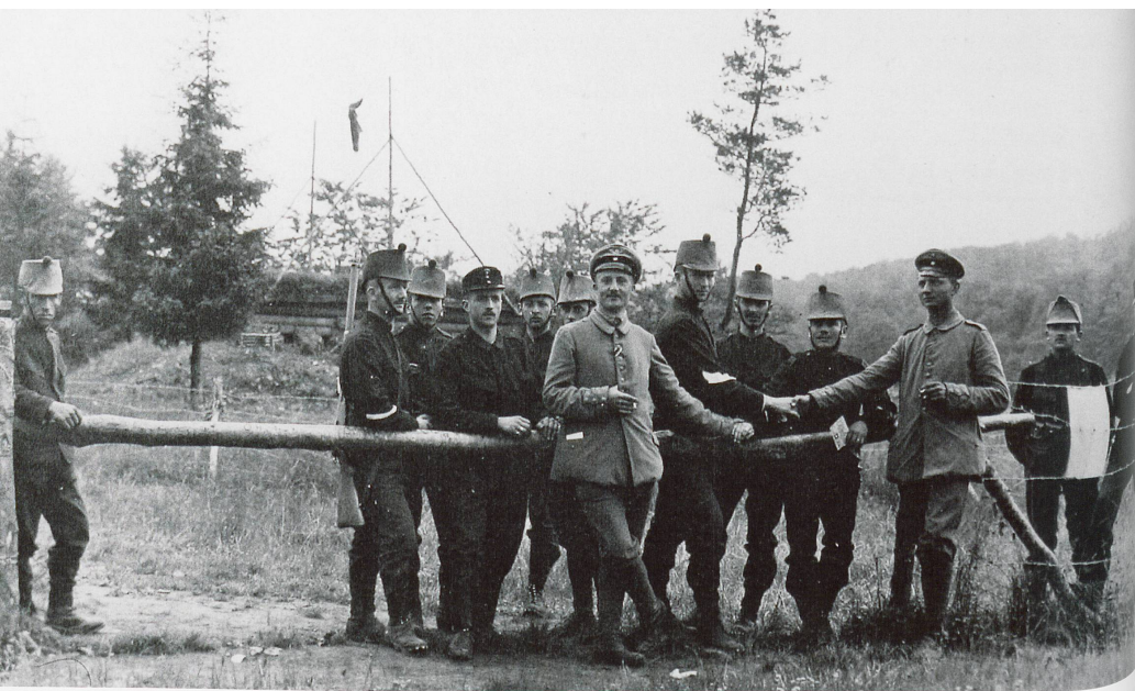
Bild oben Deutsche und Schweizer Soldaten im Largin