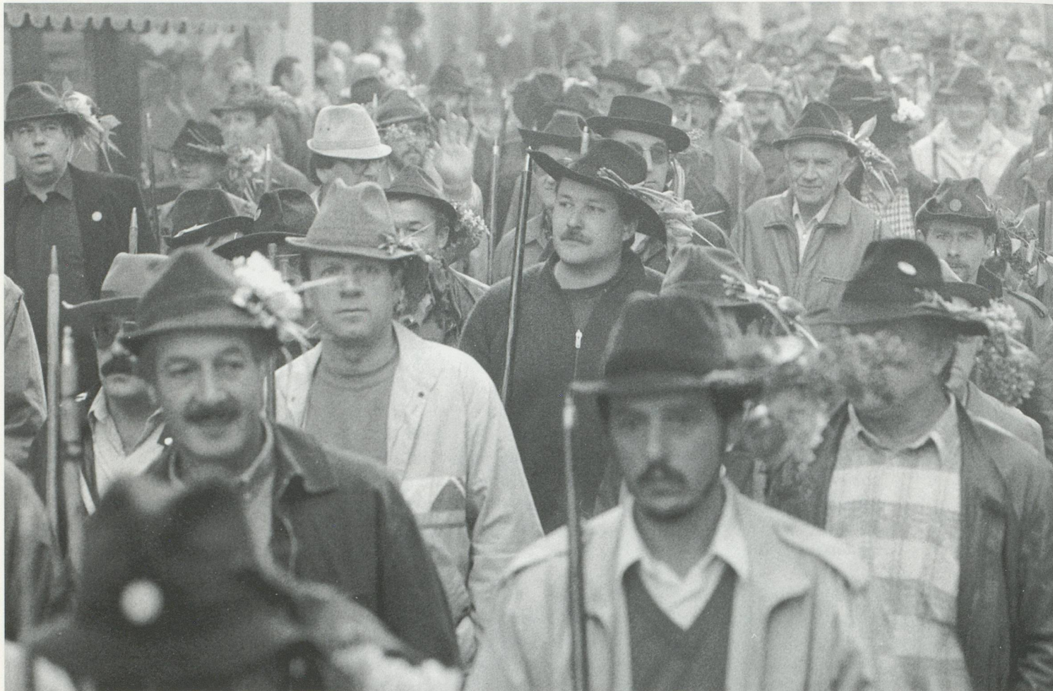
Impressionen vom Banntag 1986

Schliesslich nähten sich die aufständischen Frauen des 20. Jahrhunderts ihre eigene Fahne und gründeten eine fünfte Rotte – die Familienrotte – welche zwei Jahre lang unter Buhrufen am Banntag teilnahm, ehe sie ihr Picknick auf Auffahrt verlegte. Inzwischen ist dieser neue Brauch wieder zum Erliegen gekommen.