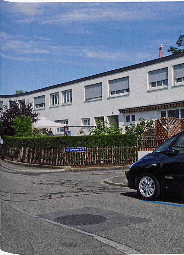
Bild unten Am Bahndamm