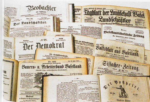
Baselbieter Zeitungen aus dem 19. Jh.

sem Grund durch weisse Buchstaben auf blauem Hintergrund ersetzt worden ist. Diese Änderung ist äusseres Zeichen für eine Zäsur in der Baselter Pressegeschichte. Andererseits konnte wohl nur dank dem Entscheid, das traditionsreiche Blatt in den Verbund der AZ Medien zu führen, verhindert werden, dass diesseits des Juras die regionale Berichterstattung von einer einzigen Zeitung beherrscht wird. Und das ist gewiss gut so.