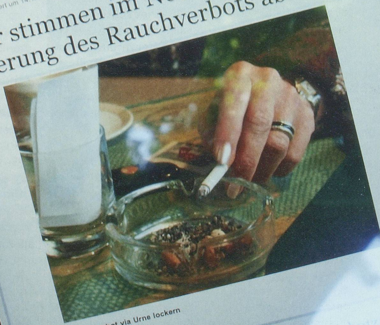
Wirtte wollen Rauchverbot via Urne lockern

Über die Initiative «Ja zu einem Nichtraucherschutz ohne kantonale Sonderregelung» wird am 27. November abgestimmt. Die Regierung hat diesen Termin am Dienstag beschlossen. Mit dem Begehren will der Wirtteverband das