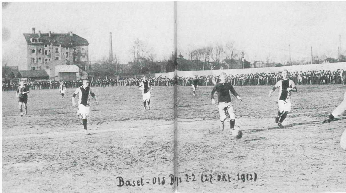
Das Basler Derby von 1912: 2:2 zwischen dem FCB und den Old Boys