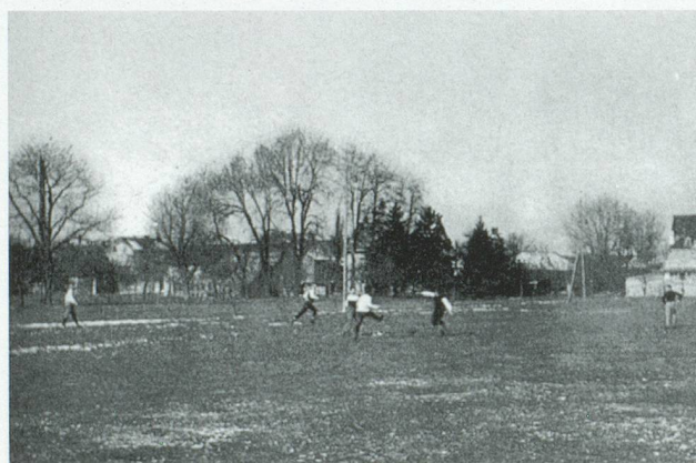
FCB-Training auf dem Landhof 1893