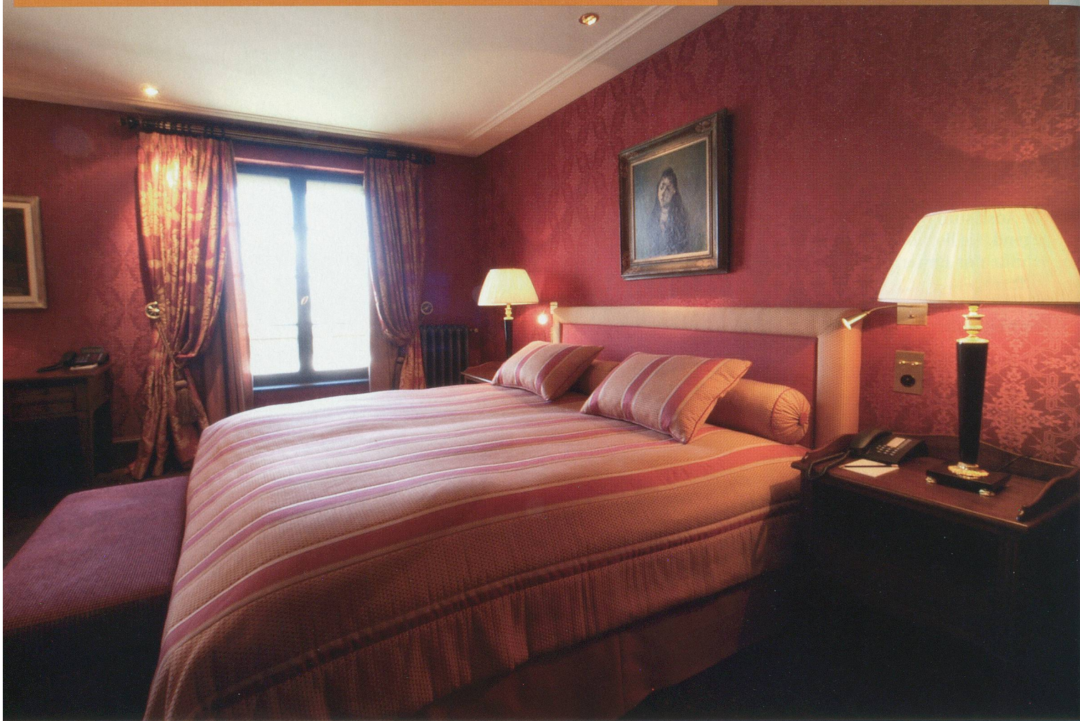
Les Trois Rois

Leute an, die nach Basel kommen, um unsere Museen zu besuchen. Das sind zum Beispiel kulturbegeisterte Gäste aus Paris, wo man vor Museen stundenlang Schlange steht, während man bei uns in der Regel problemlos in eine Ausstellung kommt.