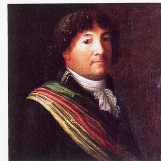
Peter Ochs, Ölgemälde von Felix Maria Diog, 1799

Die Basler sandten Peter Ochs, der Frankreich als sein zweites Vaterland empfinden mochte, mehrmals als Unterhändler nach Paris, zuletzt 1797, um über die Abtretung des Fricktals an die Stadt zu verhandeln. Es ging um Entschädigungsforderungen für den Verlust von Feudaleinkünften aus dem Elsass. Bei dieser Gelegenheit liess sich Ochs von Bonaparte beauftragen, den Entwurf einer helvetischen Verfassung