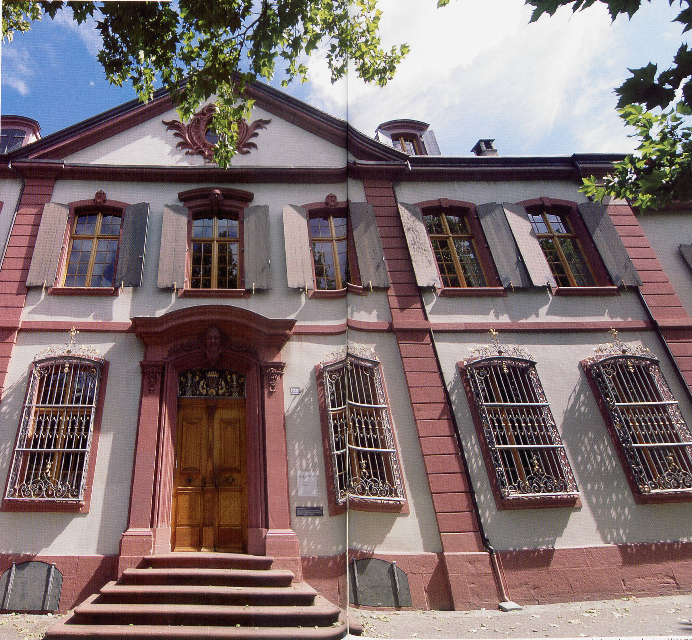
Der Holsteinerhof an der heutigen Hebelstrasse

Sie brachten die unerhört neuen Ideen von auswärts in die Stadt, die sie als eng und verstaubt empfanden. Religion, Wirtschaft, Recht, gesellschaftliche Entwicklung – dies alles sei im Lichte der Vernunft einer kritischen Prüfung zu unterziehen und zu erneuern. Letztlich ging es um Distanz zu Tradition und Autorität, um den eigenständigen Gebrauch der Vernunft, um die Freiheit und um die Gleichheit aller vor dem Gesetz.