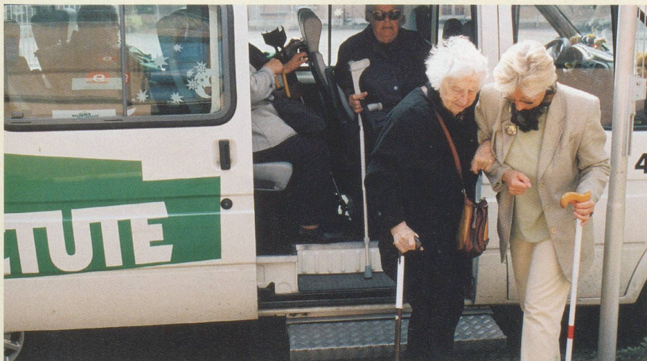
Wir fahren behinderte Betagte in den Treffpunkt Kaserne.

Wir freuen uns auf Ihren Besuch. Schauen Sie einfach herein, eine Anmeldung ist nicht nötig.