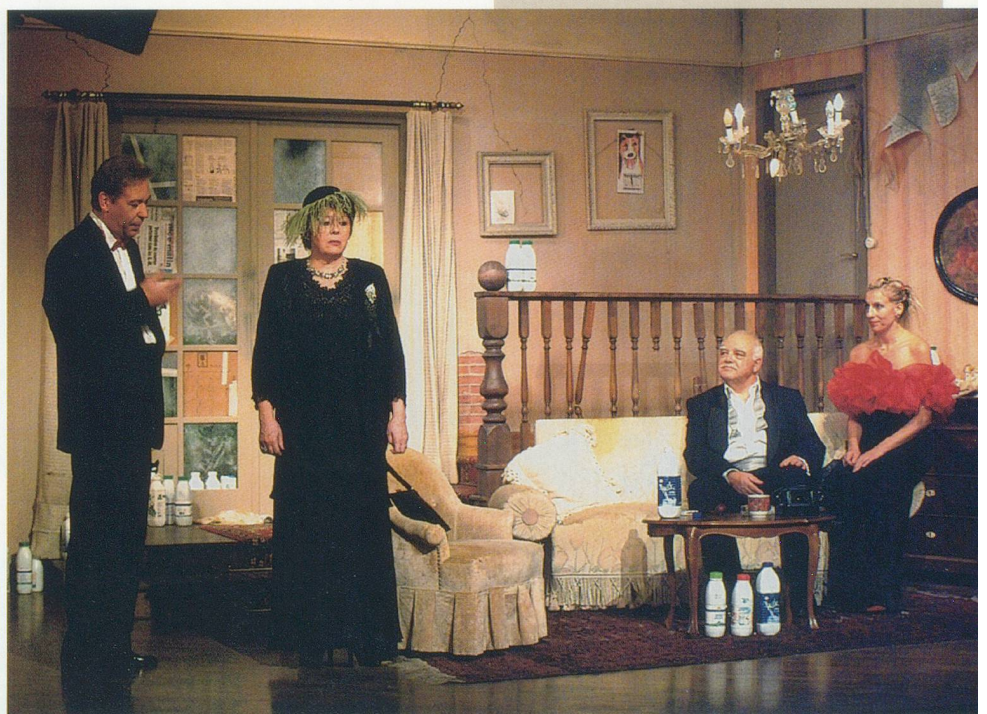
«Grille und Ameise»

«Grille und Ameise» ist ein sehr unterhaltsames Stück, welches mit viel Liebe fürs Detail und überzeugenden schauspielerischen Leistungen einen kurzweiligen Abend garantiert.