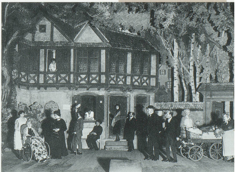
«Unerem glyche Dach» 1927 / 1943

1892 wurde die Dramatische Gesellschaft Basel gegründet. Mit einer Ausnahme wurden bis 1925 ausschliesslich schriftdeutsche Stücke gespielt. 1925 erfolgte die Gründung der Dialektgruppe «Baseldytschi Bihni». In den Anfangszeiten hatte die «Baseldytschi Bihni» keine feste Bleibe. Sie musste die Probe- und Aufführungsorte immer wieder wechseln. Daneben ging sie auf Tournee durch verschiedene Schweizer Städte. Während dem 2. Weltkrieg spielte sie an der Front und gab sich 1942 den Zusatztitel «Basler Heimatschutz-Theater», den sie noch immer in ihrem Namen führt. Ein Meilenstein stellte 1962 der Bezug des eigenen Theaterkellers an der Leonhardsstrasse 7 dar. Dort spielte die «Baseldytschi Bihni» bis 1995, als sie der baselstädtischen Schulreform weichen musste. Sie hatte aber sehr viel Glück im Unglück und fand im Lohnhof eine neue Bleibe, wo sie seit 1996 spielt.