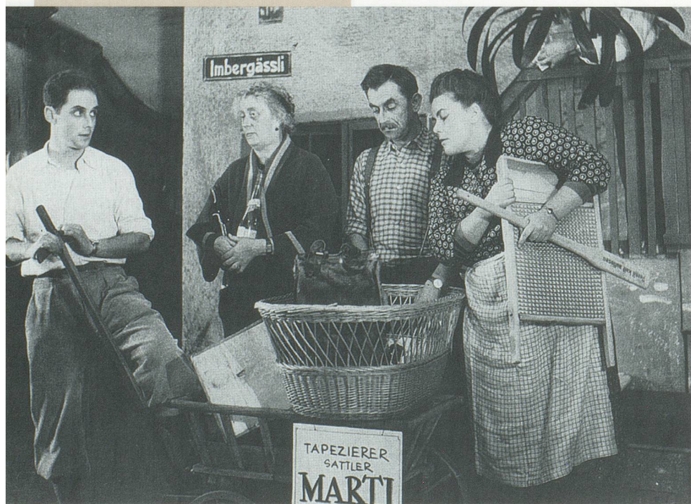
«Imbergässli 7» 1947

Ort Basler Marionettentheater, Münsterplatz Daten 13. / 19. / 20. und 21. März