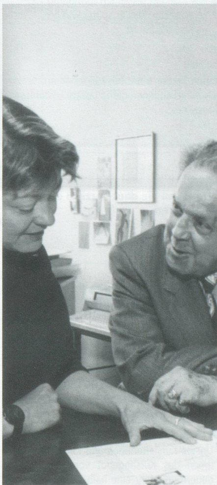
Wir beraten Sie gerne!

Um aber Hilfe in Anspruch nehmen zu können, muss man wissen, dass es sie überhaupt gibt. Deshalb hat Pro Senectute Basel-Stadt eine Informationsstelle geschaffen – übrigens die einzige dieser Art in unserem Kanton. Die Informationsstelle ist für Sie da, wenn Sie Beratung in Altersfragen brauchen – für sich selber oder für Verwandte, Freunde oder Nachbarn. Rufen Sie uns unter Tel 206 44 44 an. Wir geben gerne Auskunft und helfen Ihnen weiter.