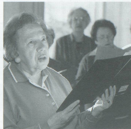
Singgruppe bei Pro Senectute Basel-Stadt

Wir tun viel und wir tun es gern! heisst unser Motto. Einige Zahlen aus dem vergangenen Jahr mögen das belegen: