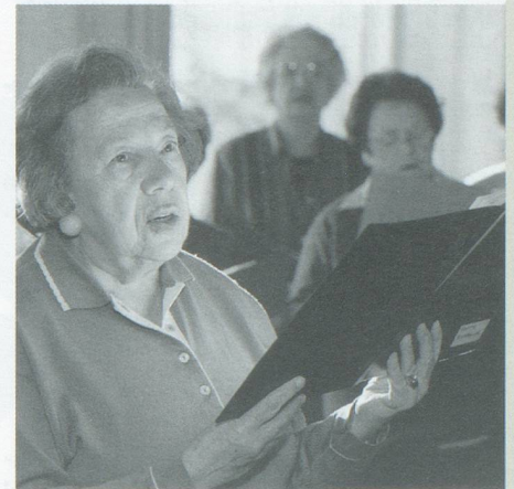
Singgruppe bei Pro Senectute Basel-Stadt

Wir tun viel und wir tun es gern! heisst unser Motto. Einige Zahlen aus dem vergangenen Jahr mögen das belegen: