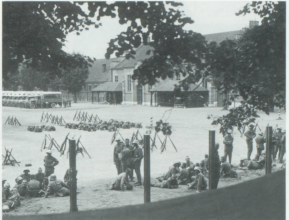
Ausbildung der Soldaten im Kasernenhof