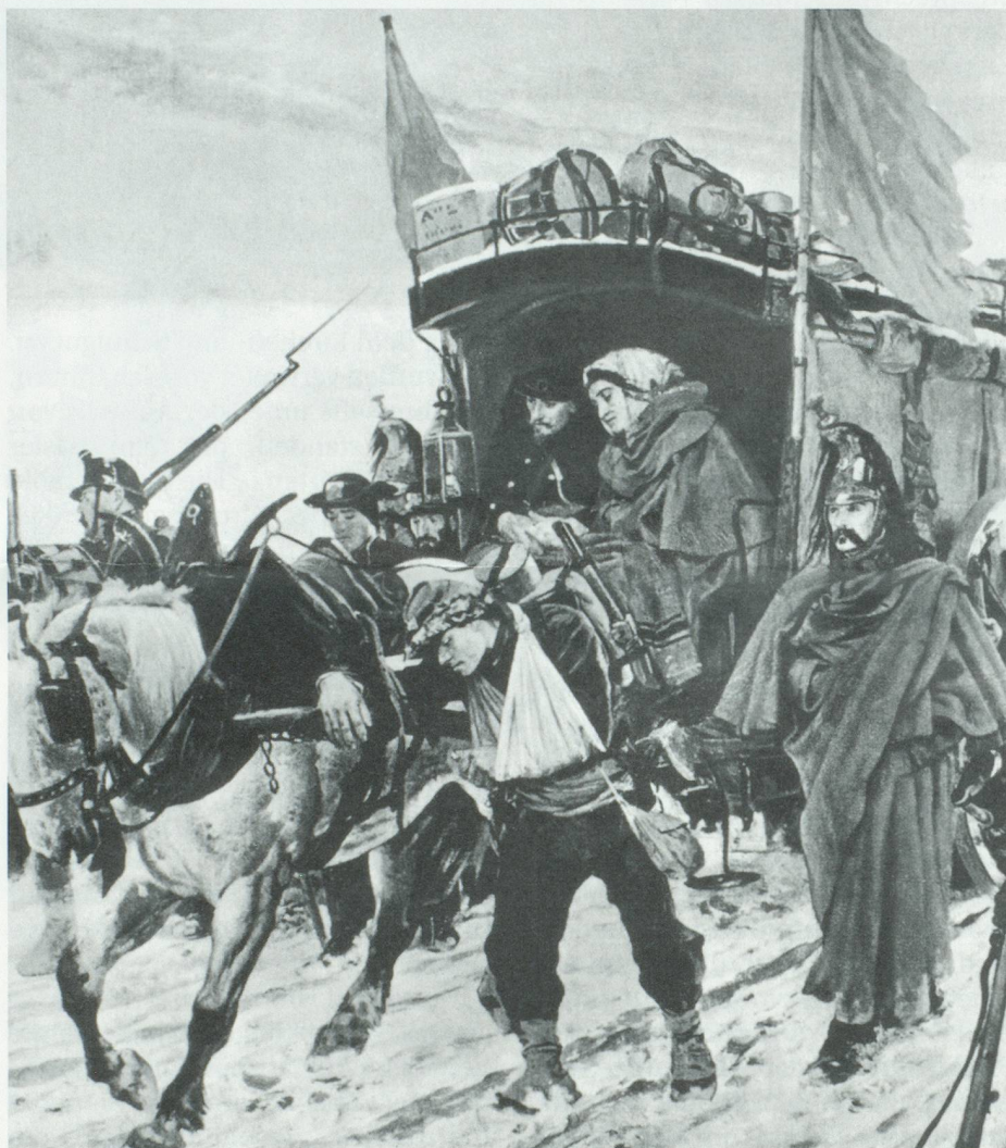
Rückzug der Bourbaki-Armee