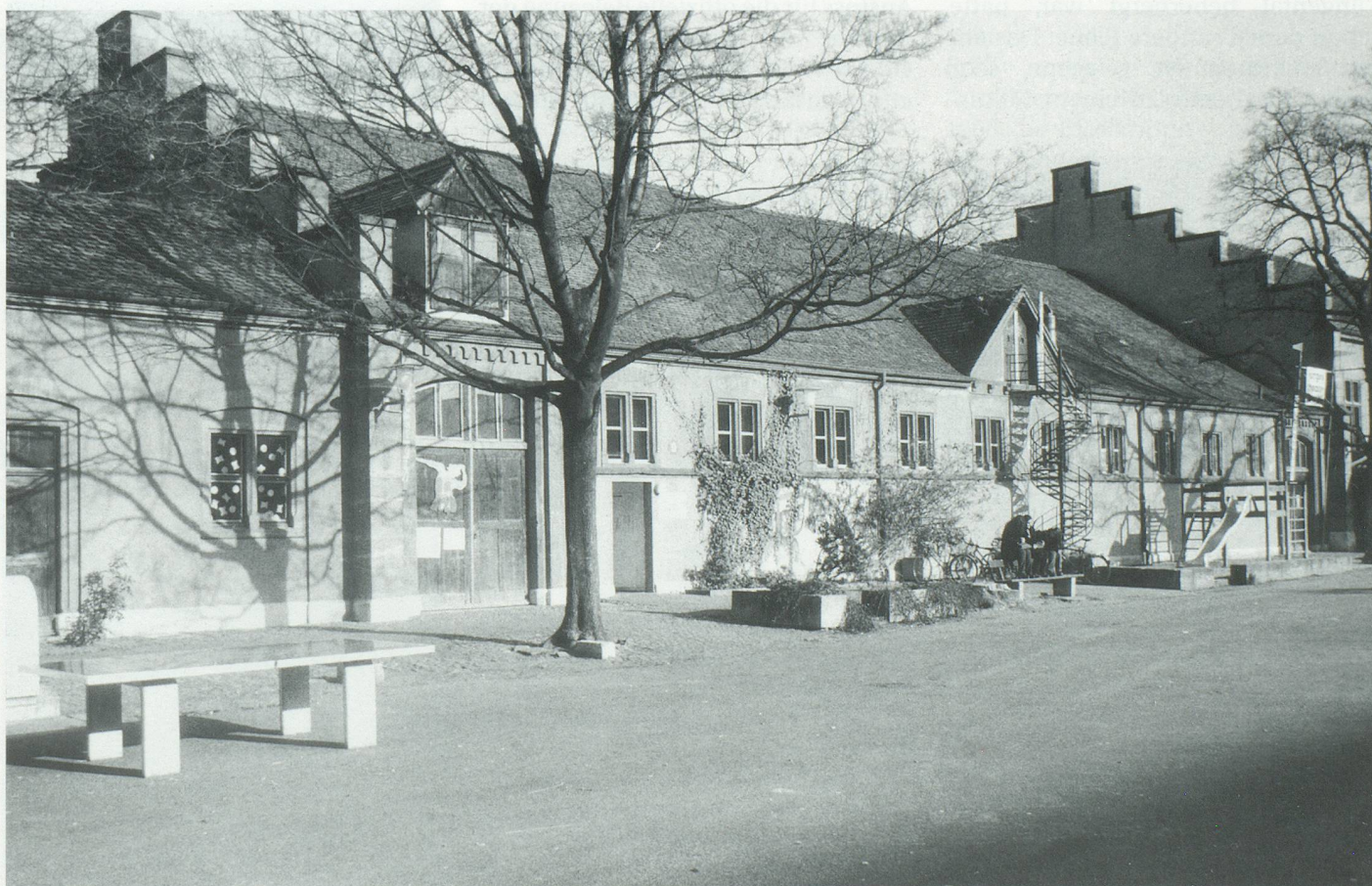
Die ehemaligen Pferdeställe – heute Begegnungsort für Jung und Alt