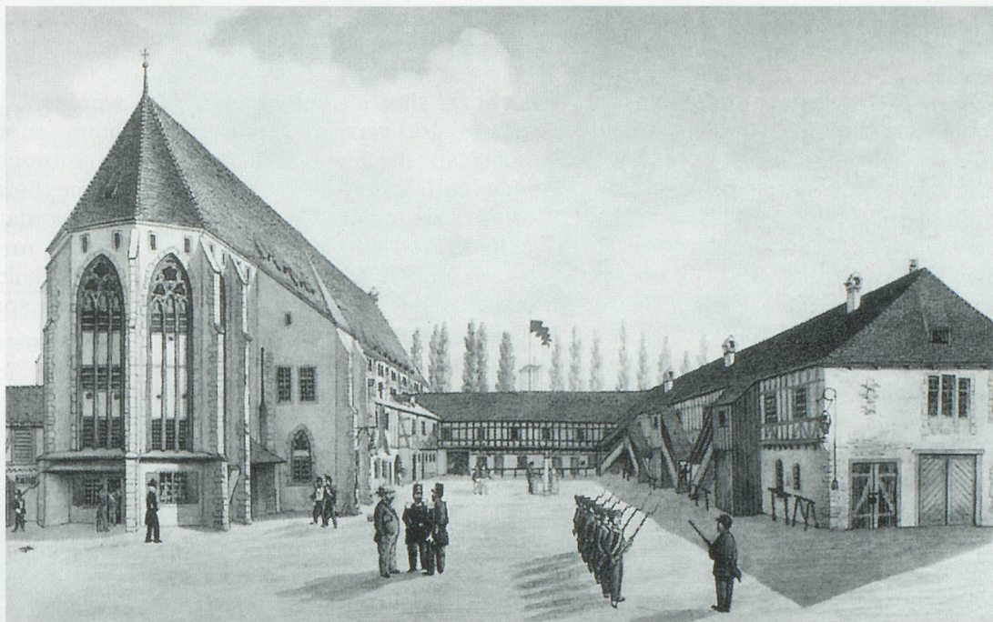
Kaserne Basel um 1860

Nach dem Tod der letzten Äbtissin, Walpurga von Runs, im Jahr 1557 wurde das Kloster Klingental vom Staat übernommen. Die Aufhebung der Klöster und Stifte durch die Reformatoren war eine populäre Massnahme, nicht zuletzt wohl, weil deren Besitz im Mittelalter dank Schenkungen sehr gewachsen war. Gundbesitz und Vermögen wurden vom Staat übernommen. Die Klostergüter schlug man in der Staatsrech-