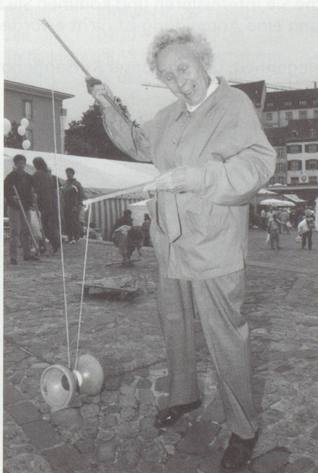
... und alt.