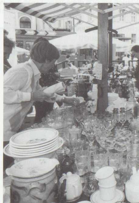
Schnaigge am Flohmarkt.