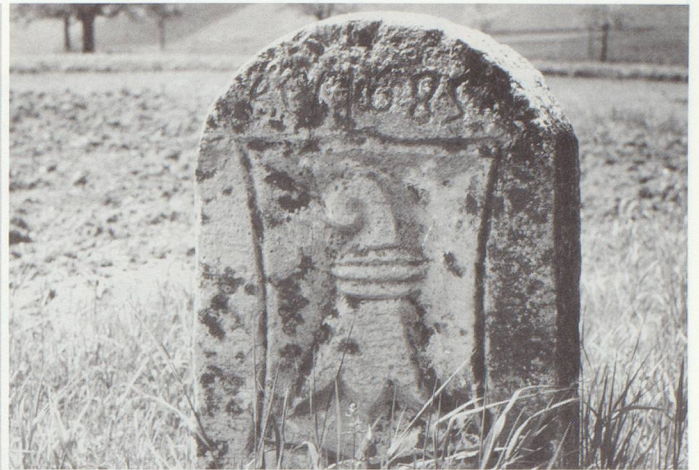
▲ Grenzstein im Baselbiet – Maisprach