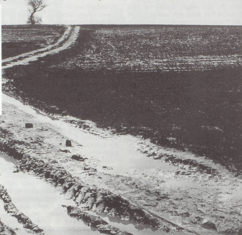
▲ Pfade für Kenner

Wer kennt sie nicht, die stimmungsvollen Landschaftsaufnahmen des Basler Fotografen Ludwig Bernauer, die regelmässig in der Basler Zeitung veröffentlicht werden? Den Akzént-Lesern zeigt Ludwig Bernauer eine kleine Auslese von seinen unzähligen Impressionen, die er bei seinen fotografischen Streifzügen durch die Regio festgehalten hat. Für die stimmungsvollen Jura- und Sundgauerlandschaften sprechen für sich. Lassen Sie die Bilder auf sich einwirken.