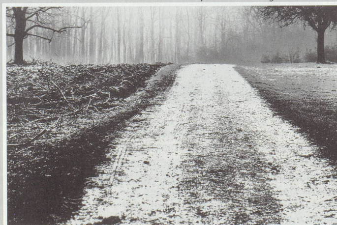
▼ Bruderholzweg ohne Kosmetik