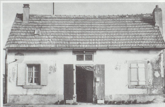
▲ Kanalhäuschen – Rhein/Rhône-Kanal