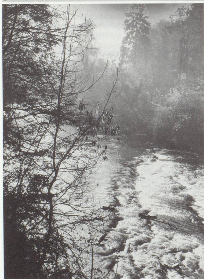
▼ Birsschlucht bei Münchenstein