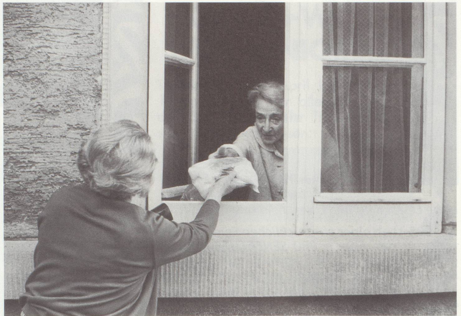
Das Überbringen von Mahlzeiten und ein paar freundschaftliche Worte – Alltag für unsere Verträgerinnen