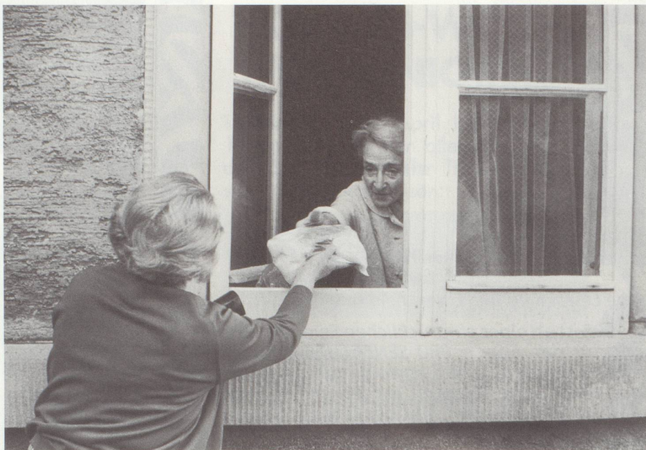
Das Überbringen von Mahlzeiten und ein paar freundschaftliche Worte – Alltag für unsere Verträgerinnen