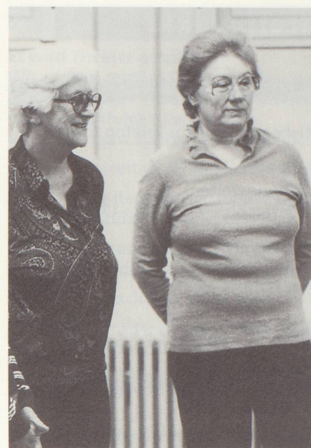
Bewegung und Gemeinschaft – auch zuschauen gehört dazu