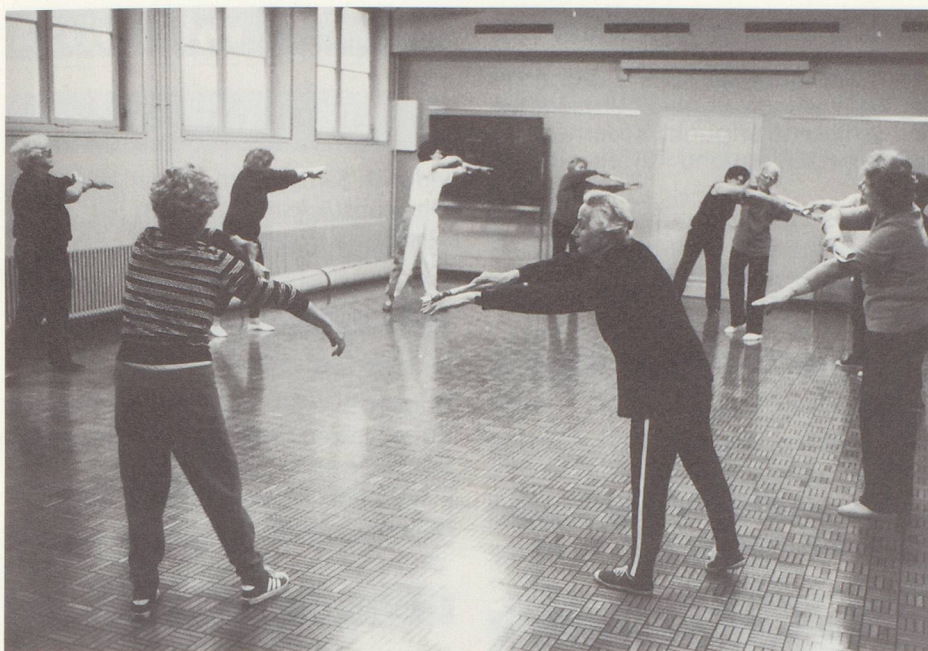
Bewegung und Gemeinschaft – beim Turnen