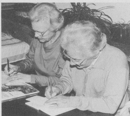
Gemeinsam lernen macht uns Freude.

Interessentinnen und Interessenten melden sich bitte unter: Telefon 272 30 71 (08.00 – 11.30 Uhr)