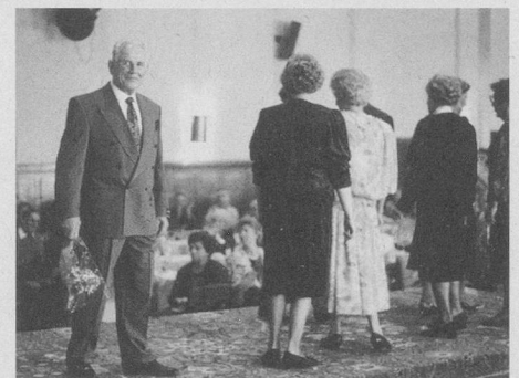
Der elegante Herr – gesehen an der Modenschau vom Polka-Träff in Liestal.