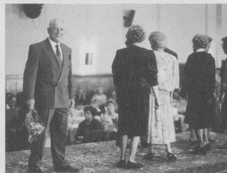
Der elegante Herr – gesehen an der Modenschau vom Polka-Träff in Liestal.

Leitung und Auskunfte: Erika und Paul Rudin-Strub Telefon 061-921 12 65