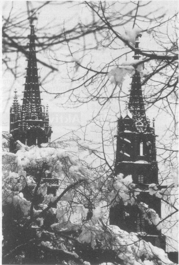
Blick durch verschneites Geäst auf die Münstertürme

aus Beat Trachsler «Unter Basler Bäumen» GS-Verlag Basel