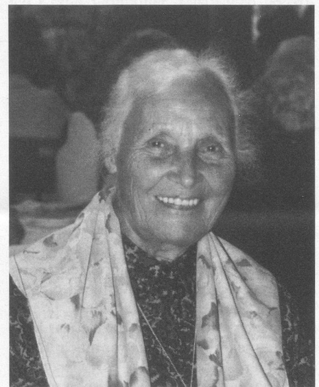
So gab es dann auch viele strahlende Gesichter.