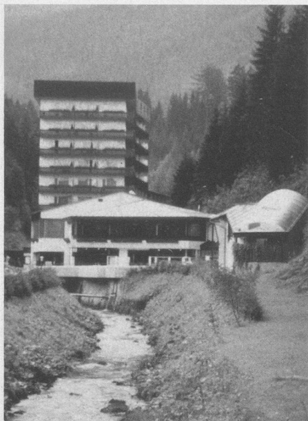
Hotel Heilbrunn in Bad Mitterndorf