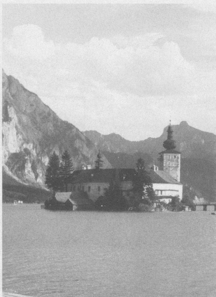
Schloss Ort in Gmunden am Traunsee