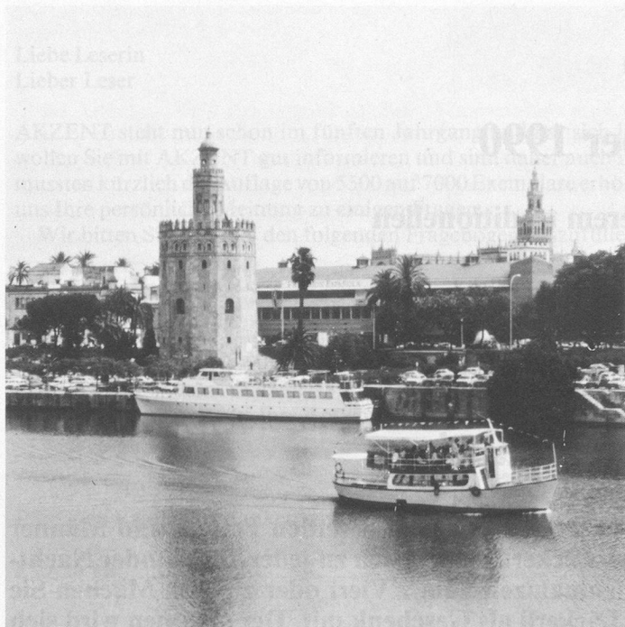
Sevilla: Giralda und Kathedrale