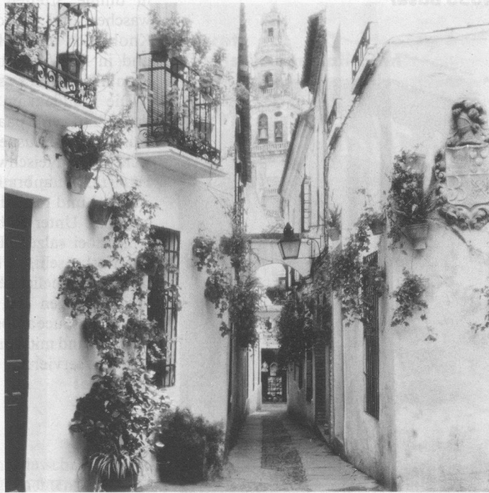
Cordoba: romantische Altstadt