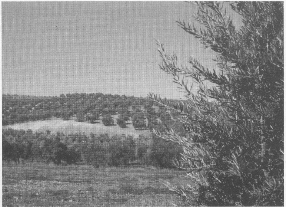
Olivenhaine, so weit das Auge reicht, auf der Carfahrt von Malaga nach Cordoba.

Am Sonntag hiess es dann um 8 Uhr Koffer vor die Tür stellen, nachher Frühstück, 9.30 Uhr Abfahrt nach Granada. Die Fahrt dorthin war gemütlich und sehr schön. In Granada hatten wir mit dem Reiseführer nicht so viel Glück. Er war ein lieber Kerl, vielleicht verstand er auch etwas von seinem Beruf, aber deutsch sprechen konnte er nur mangelhaft. Er tat mir richtig leid, wenn er verzweifelt nach Ausdrucksmöglichkeiten suchte, und wenn er sie gefunden hatte, wiederholte er sie ein paarmal, wohl in der Hoffnung, wir würden ihn so besser verstehen.