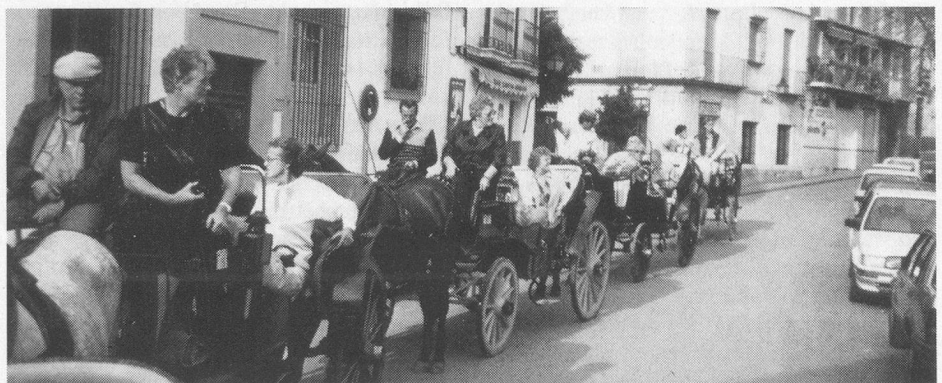
Die herrliche Kutschenfahrt.