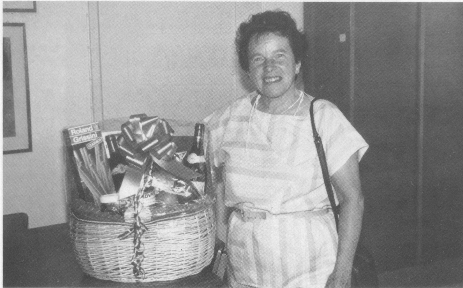
Gross war die Freude über die prächtigen Fruchtkörbe.