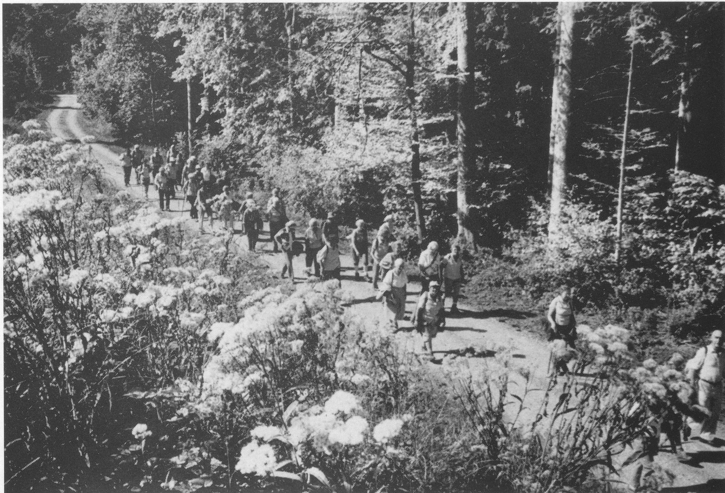
Durch Feld und Wald...