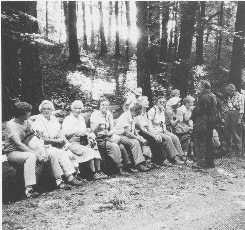
Auch eine Ruhepause gehört zum gesunden Wandern.