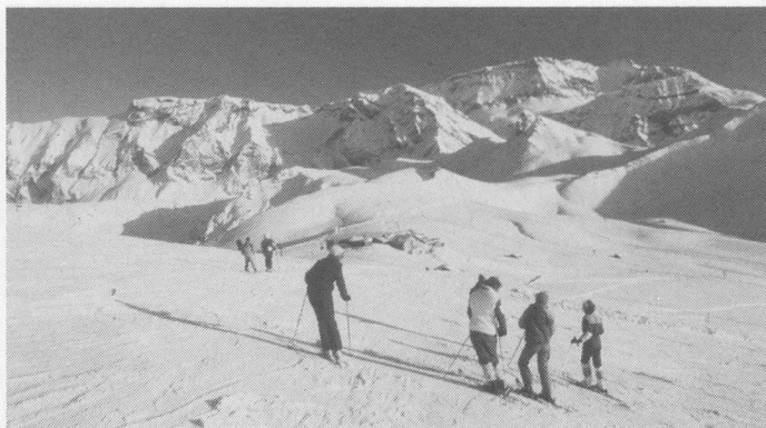
Skisport hält fit.

Christoph-Merian-Platz 5 Donnerstag 15.00