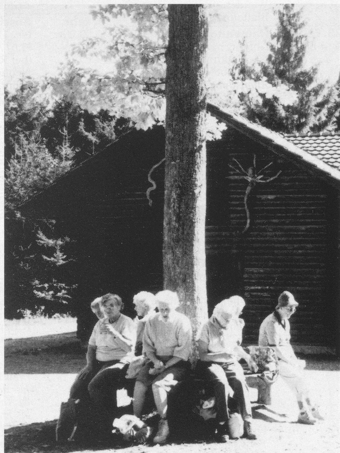
Mein Freund der Baum.