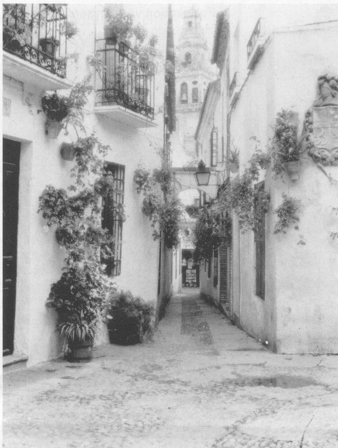
Cordoba: romantische Altstadt.