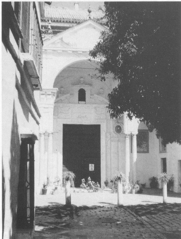
Sevilla: das Kloster von Santa Clara.