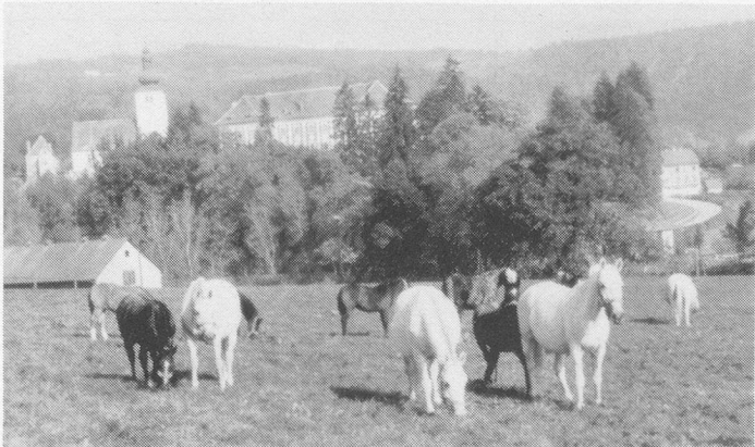
Lippizaner-Gestüt in Piber.