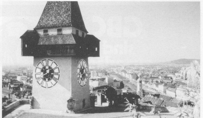
Graz – Hauptstadt der Steiermark.