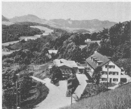
Das schön gelegene Ferienheim HUPP