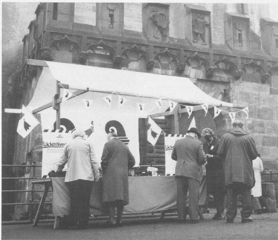
Freiwillige Helferinnen verkaufen an der Herbstsammlung die beliebten «Läckerli»