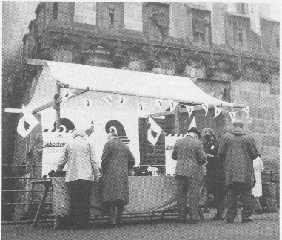
Freiwillige Helferinnen verkaufen an der Herbstsammlung die beliebten «Läckerli»