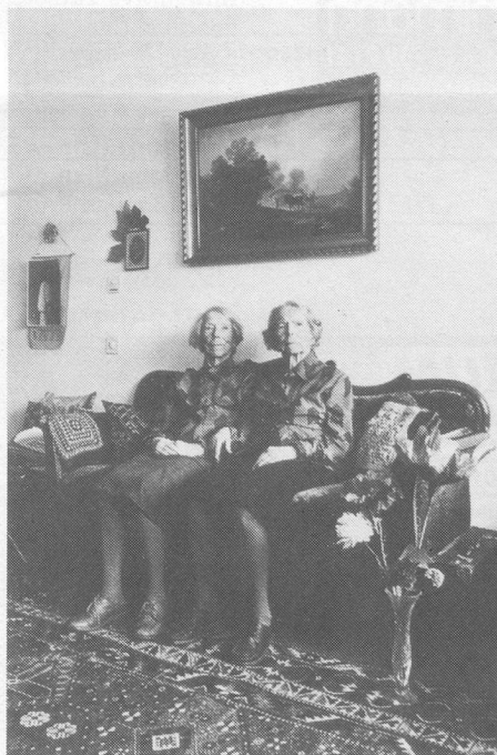
Porträts von Menschen über Achtzig