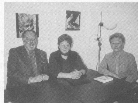
3 Vorstandsmitglieder der Grauen Panther Basel

Wer gedacht hat, die Grauen Panther seien nur bei unseren Nachbarn in Deutschland anzutreffen, ist kürzlich eines besseren belehrt worden. Pressemeldungen informierten Ende Jahr über die Gründung der Grauen Panther in Basel. AKZENT wollte die kämpferischen Senioren kennenlernen. Hier ein Kurzbericht über ein Gespräch mit drei Vorstandsmitgliedern des neu gegründeten Vereins.