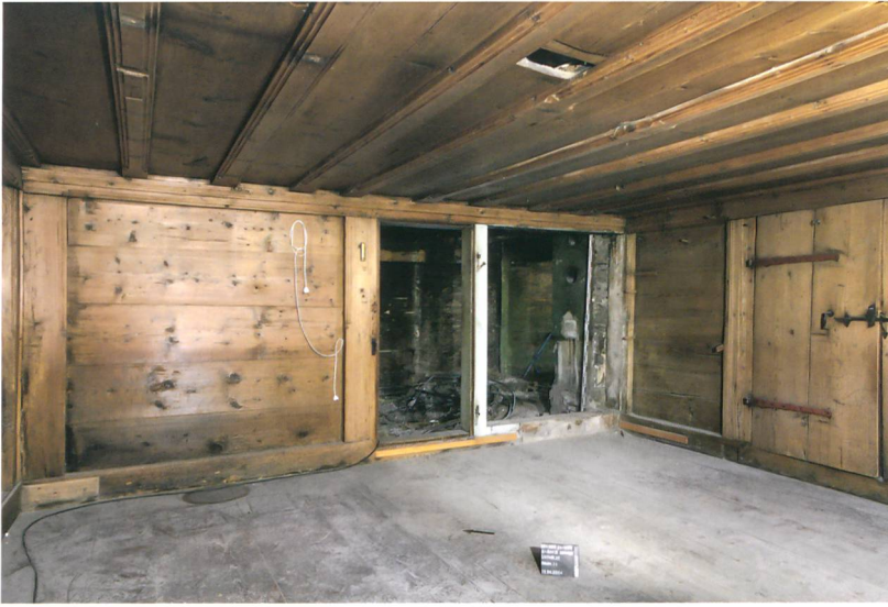
Abb. 3: Saanen-Gstaad, Litzistrasse 21. Die Stuben sind als Bohlen-Ständerkonstruktion errichtet. Alle vorkragenden Elemente sind durch eine Profilierung betont, die sich auch an den Balken der Decke finden. Blick nach Osten.