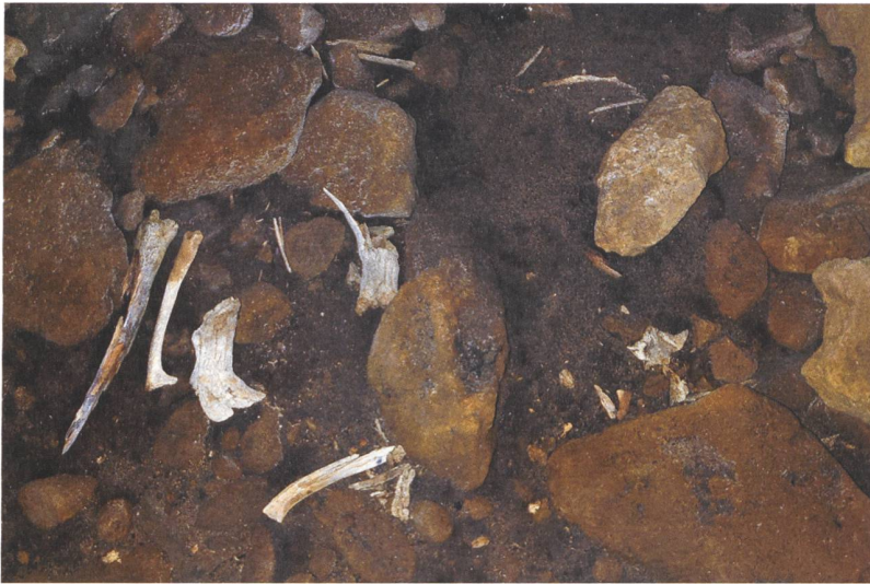
4 Beatenberg, Pfahlhöhle. Knochenreste des Rothirsches auf dem Boden des Zentralraums.

ein warmes und feuchtes Klima gekennzeichnet war, sodass Laubmischwälder bis auf 2000 m ansteigen konnten. Das damalige Biotop mit einer halboffenen Landschaft, die von einem Mosaik aus sumpfigem Grasland, Felsrasen in den höheren Lagen und Wäldern auf den dickeren Böden geprägt war, stimmte gut mit den ökologischen Anforderungen der Art überein. Aus archäologischer Sicht fällt der Zeitraum in das späte Mesolithikum. Zu dieser Zeit wurden die Voralpenregionen, die nahezu vollständig bewaldet waren, mindestens für die Jagd durchstreift. Die Höhenlagen wurden erst viel später für die Viehzucht gerodet, vor allem in den Metallzeiten, als es Sommerweiden gab (Reynaud Savioz und Blant 2021).