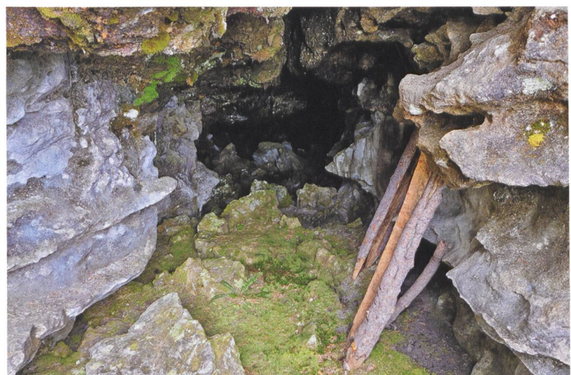
3 Beatenberg, Pfahlhöhle. Haupteingang der Höhle.